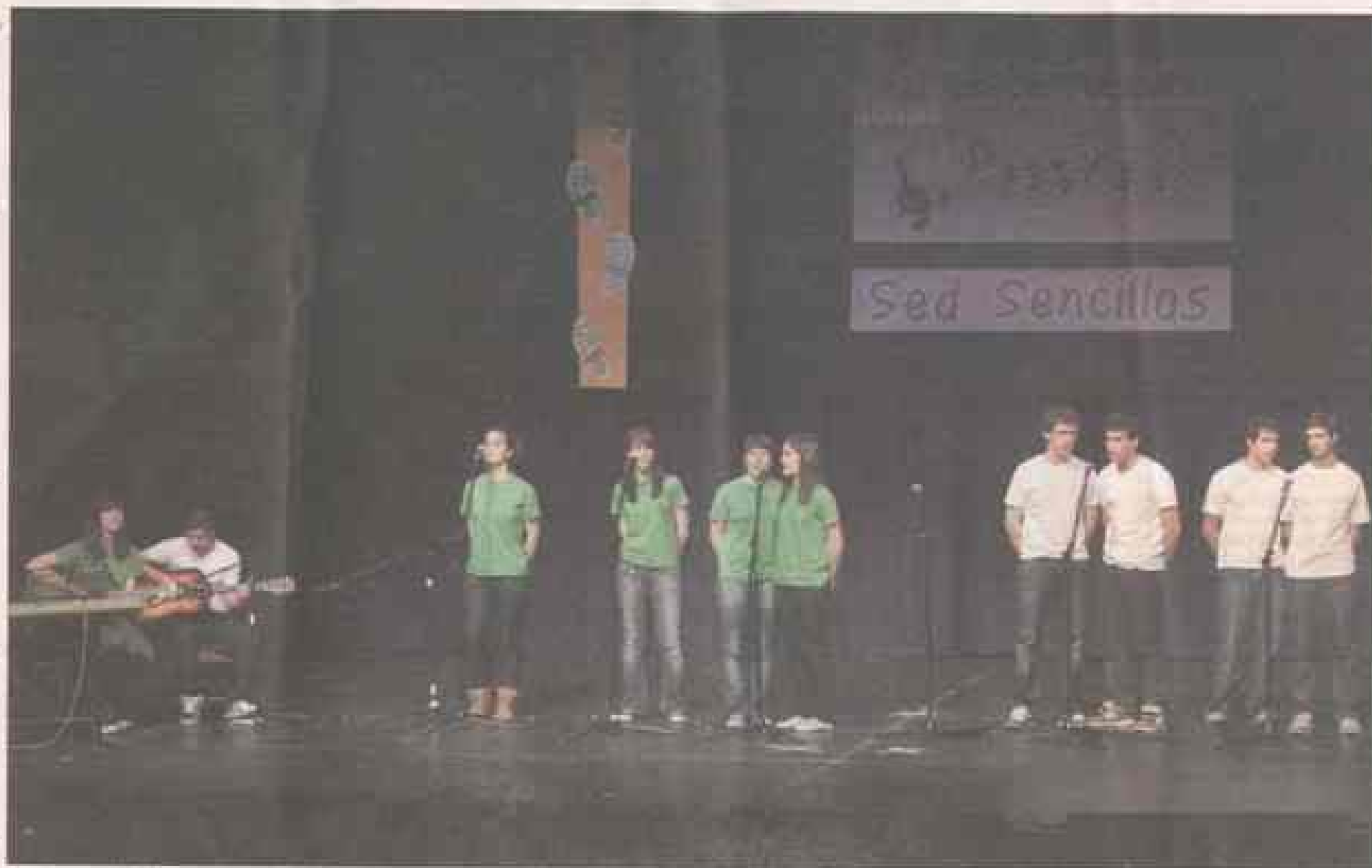
El certamen está dividido en dos categorías, en las que se premian las tres mejores canciones, interpretadas por el grupo L'Humor.