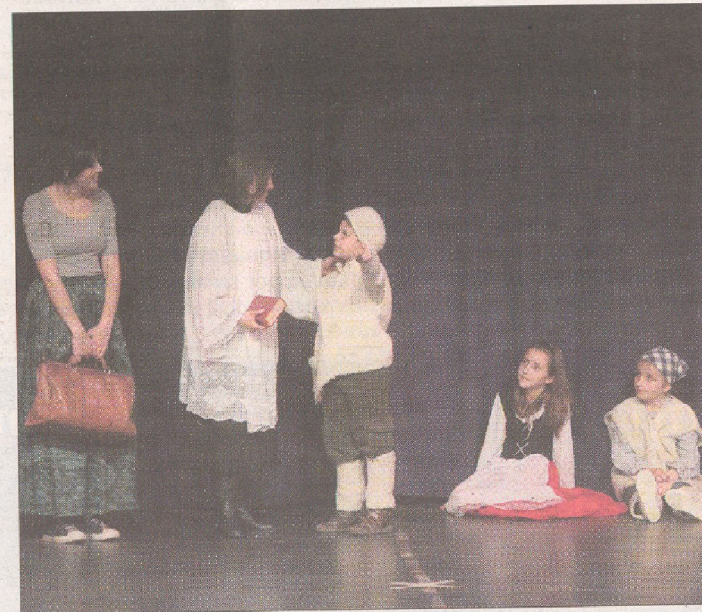
Los más pequeños, en plena interpretación.

completó, como en otras ocasiones, con canciones que se cantan a coro y que conocen todos los estudiantes de todas las edades. El festival es la parte más importante, pero no es la única de un encuentro que comenzó el pasado viernes y que termina hoy.